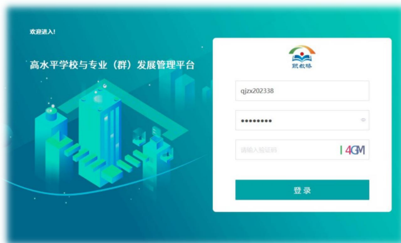
图 24 高水平中职学校项目管理平台

围绕智慧校园平台建设安装了《校园和课堂监控系统》、《校情监测与分析系统》的第一期、《宿舍管理系统》、《饭堂管理系统》、《高水平中职学校项目管理平台》、《精斗云大数据精准教学系统》等，按计划稳步推进学校信息化建设，为学校的各项决策提供依据。