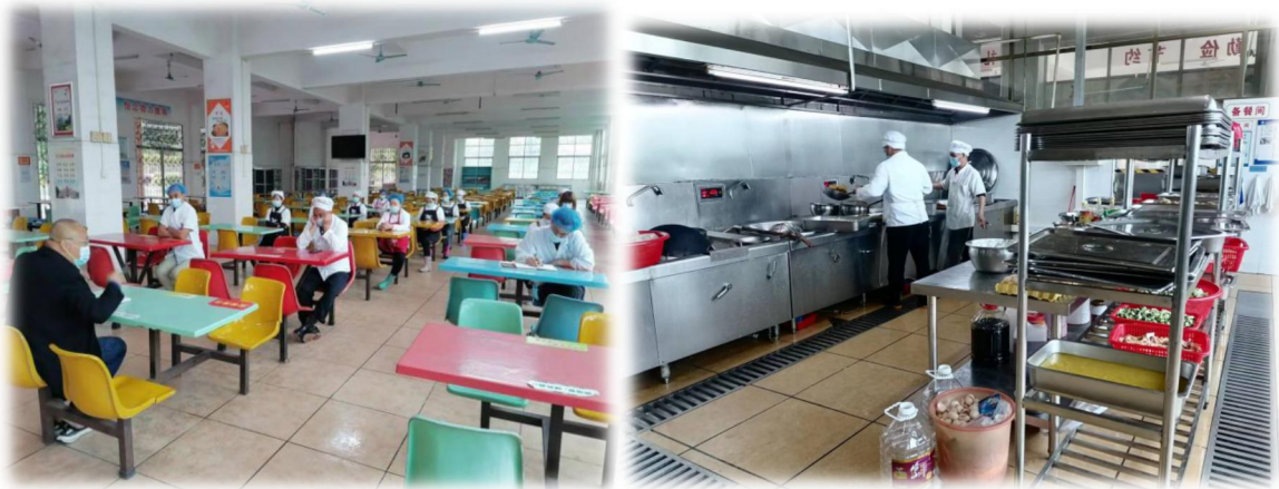
图 21 食堂员工进行食品安全工作培训