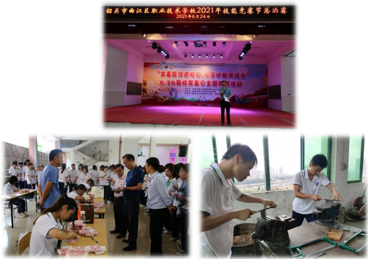
图 19 曲江职校技能竞赛节情况

为贯彻落实国家、省职业教育大会精神，2022年7月22日，学校举办主题为“技能让生活更美好”职业技能宣传周活动。2021级学前教育试点大专班的学生开展手工制作展示活动；学校志愿者团队到马坝街和马坝公园发放新修订《职业教育法》小册子；全校开展学习新修订《职业教育法》的主题班会。职业技能宣传周不仅向社会宣传了职业教育大有可为，还为学校的发展注入了强大的精神动力。