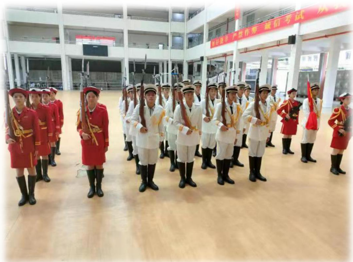
图 1.2 曲江职校国旗护卫队