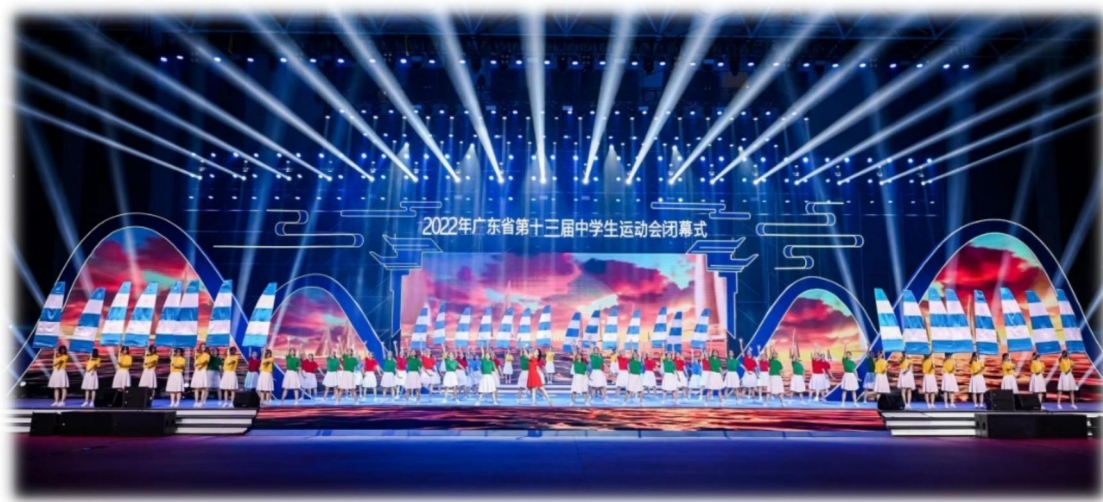
图 5 学生在省第十三届中学生运动会闭幕式上展示风采

为深入贯彻国务院办公厅《关于全面加强和改进学校美育工作的意见》文件精神及省、市深化新时代学校美育工作要求，全面加强和改进我校美育工作，大力提高学生审美和人文素养，促进学生德智体美全面发展，学校利用学前教育专业的资源，加强美育的渗透与融合，将美育贯穿在学校教育的全过程。充分发挥语文、历史等人文学科的美育功能，将相关学科的美育内容有机整合；多形式开展美育活动，例如典诵读比赛、元旦文艺汇演、校园歌手大赛、大合唱等；开足开齐美育课程，学校美育课程主要包括音乐、美术、舞蹈等。参加韶关市中小学经典诵读比赛获特等奖。2022年8月8日，100多位师生在广东省中学生运动会上精彩演绎的大型舞蹈《舞动·绿色旋律》，以恢宏的场面，荡气回肠的磅礴力量带给了观众一场视觉盛宴，彰显了曲江职校人积极、健康、向上的良好风貌。围绕美育目标，形成课堂教学、课外活动、校园文化的育人合力。