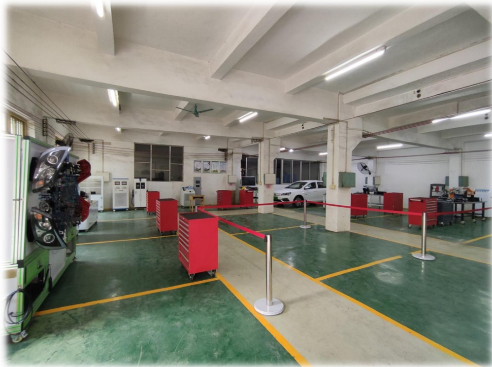
图 12 曲江职校新能源汽车实训室