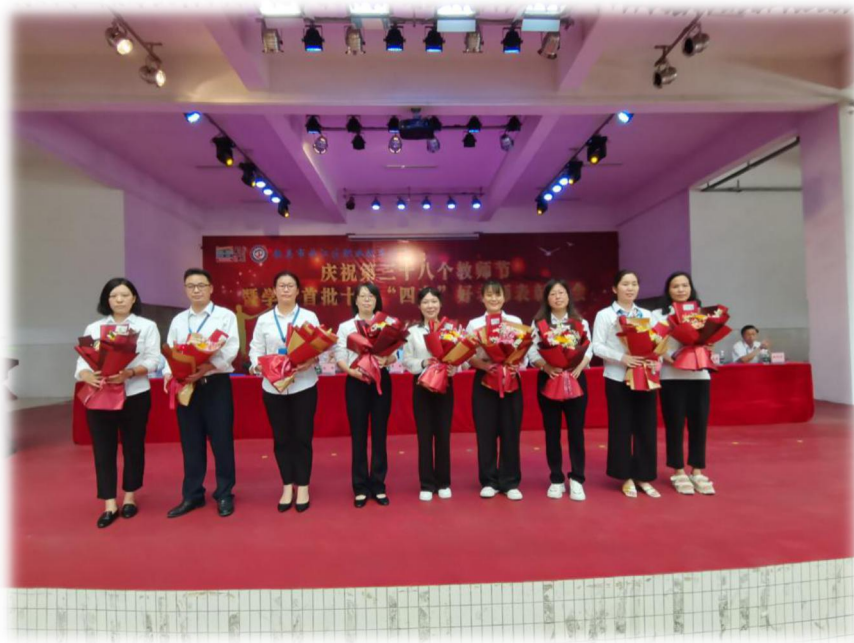
图 15 曲江职校“四有”老师颁奖典礼