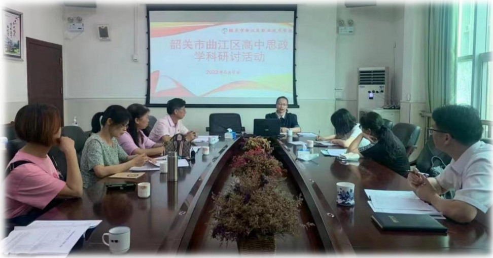
图 23 思政课教师教研活动