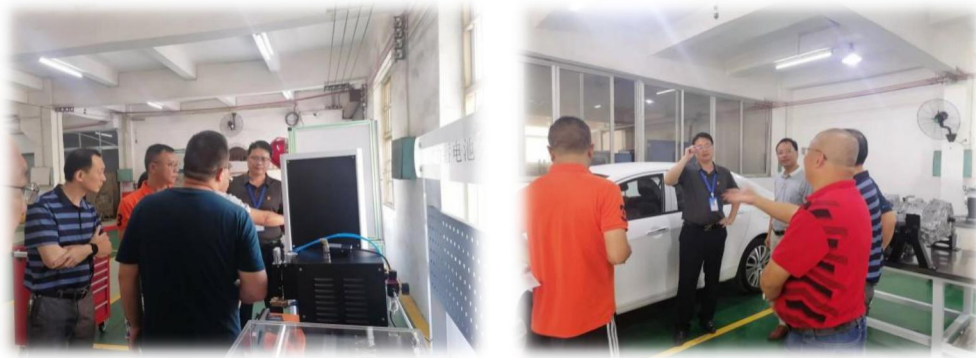
图 25 验收组验收学校新能源汽车实训室