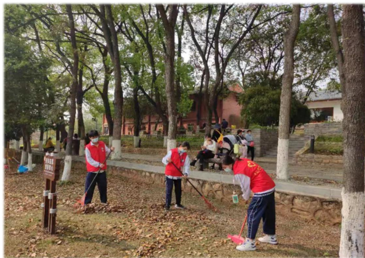
图6 学生志愿者在狮子岩景区开展亮丽行动

结合创建全国文明城市工作，开展师生志愿服务活动，提升学生的志愿服务精神；开展“文明班级，文明寝室，文明学生”评比活动，将创建文明城市和文明校园各项活动推向深入；积极开展爱国卫生义务劳动，发动广大师生大力整治校园周边环境卫生，清除卫生死角，为师生创造舒适的学习生活环境，培养学生的劳动意识；开展家务劳动，体会劳动的乐趣，感受父母的辛劳，培养感恩之情和独立自主的能力。