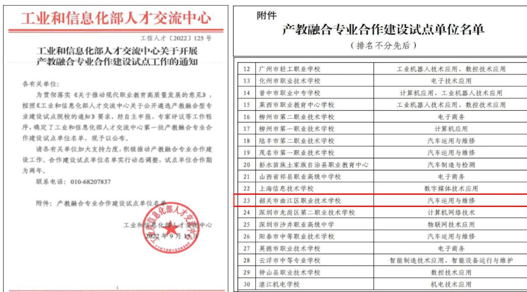
图 17 学校被确定为第一批产教融合试点单位