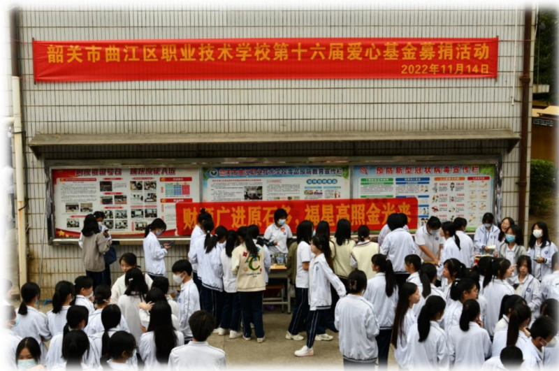
图片 9 学生开展爱心义卖活动