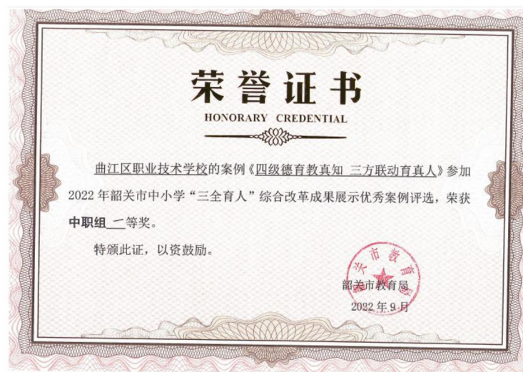
图7 学校德育案例获市中职组一等奖

为了贯彻习近平新时代中国特色社会主义思想，加强党的全面领导，落实立德树人根本任务，学校围绕高水平中职学校建设，落实“三全教育”工作。成立德育工作领导小组，学生处、教务处、实训处、系部长、班主任、家委会等为领导组成员，形成由一把手挂帅，全员全方位全过程育人的领导团队。构建“四德”育人体系，崇德——崇尚优秀的道德品质，初步养成良好的行为习惯；立德——树立优秀的道德品质，打好做人根基；厚德——优秀的道德品质进一步内化，逐渐积累，以树立正确的世界观、人生观；弘德——毕业后，在行业和社区中形成良好的口碑和声誉，成为榜样。学生从入学到就业，实现全程育人目标，形成全员全过程全方位育人格局，着力培养有理想、有情怀、有责任、有担当，德智体美劳全面发展的社会主义建设者和接班人。