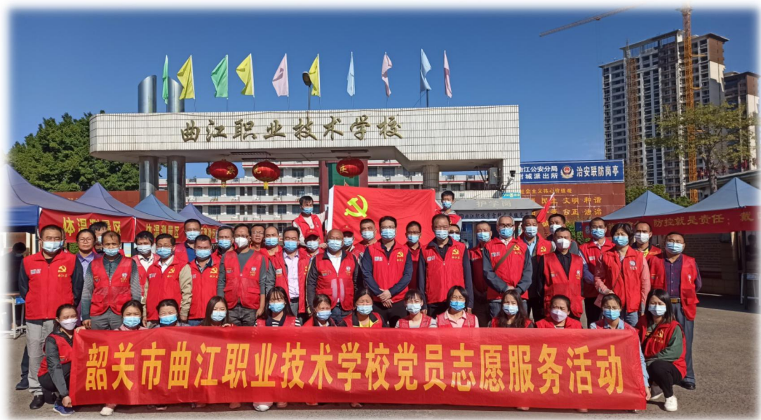
图 20 党员积极参与疫情防控

学校深入学习贯彻习近平总书记系列重要指示精神，完整、准确、全面贯彻落实党中央关于新冠肺炎疫情防控的决策部署，切实担负起防控责任。坚定不移坚持人民至上、生命至上，坚定不移坚持“外防输入、内防反弹”总策略，坚定不移坚持“动态清零”总方针，落实好第九版防控方案和二十条优化措施，确保不动摇、不走样。充分发挥党员教师的先锋模范作用，主动向所在街道社区党组织对接，在做好自身防护和严格遵守防疫规定的同时，积极参与防疫志愿服务，让党旗在统筹疫情防控和经济社会发展中高高飘扬。