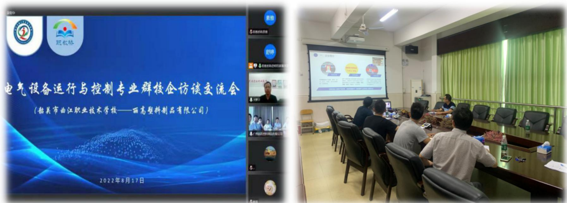
图 11 电气设备运行与控制骨干教师参与专业建设线上培训