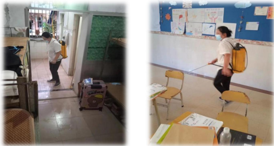
图 22 学校对教室、宿舍杀菌消毒

学校严格落实《韶关市冬季爱国卫生运动倡议书》、《中小学卫生厕所与维护管理工作指南》、《曲江区诺如病毒感染性腹泻等冬春季传染病疫情防控电视电话会议》等文件精神，做好卫生健康工作。认真做好传染病、慢性病如流感、诺如病毒、肺结核、水痘等公共卫生事件的筛查和防控工作；加强爱国卫生工作，开展校园包干区，创文保洁区的卫生打扫及“厕所革命”等工作；每月对各主要场所、校道及房前屋后进行杀菌消毒，抛撒硫磺、雄黄，清除马蜂窝等，杜绝蚊虫滋生蔓延和蛇鼠野蜂的出没，确保师生身体健康。