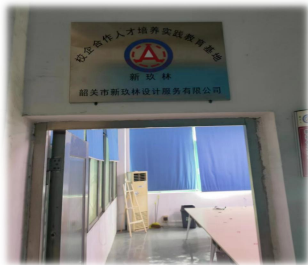
图 16 校企合作的实训基地