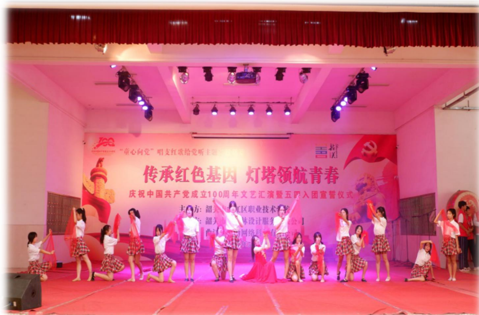
图 2 爱国主义主题演出

科学素养、心理健康、文明上网等各方面的教育。实行分管共青团工作的党支部成员定期上团课制度，对团员进行党的基本知识教育，凝聚学生的思想政治意识。