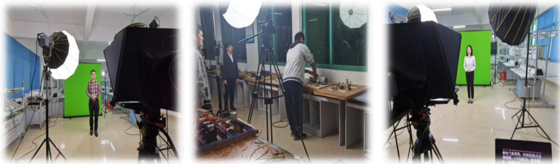
图 13 专业带头人拍微课视频