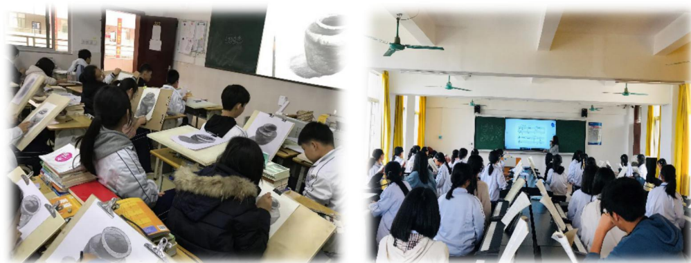
图 18 学生上专业技能课

培训 920 人、1+X 培训 105 人、专业课程考证培训 513 人、职业技能等级认定培训 206 人。节假日开放学校的室外运动场地给当地的居民锻炼身体，开放场地给曲江区青少年宫进行各类项目的课程培训，如篮球、足球、跆拳道等。承接广东省中等职业技术教育专业技能课程考试，如艺术、机械、电工、美术、舞蹈等课程证书的实操和理论统考。