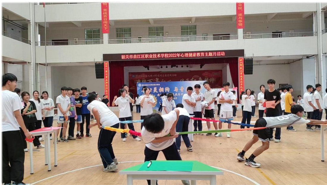
图 8 学生参与心理健康游园活动