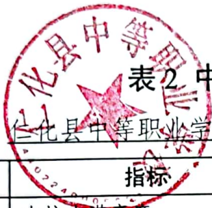
表2 中等职业教育满意度调查表