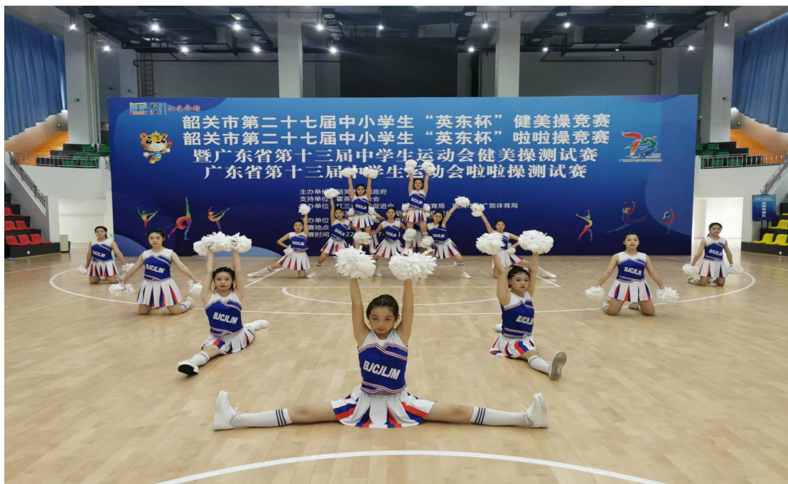
图 1-3 参加第 27 届英东杯啦啦操竞赛比赛现场

学们的出色发挥，首次参加该项比赛获得了高中组第二、团体第四的成绩，这大大增加了学校和学生以后争取更好成绩的信心，同时也促进了我校的美体教学，更好地培养学生德智体美劳全面发展。