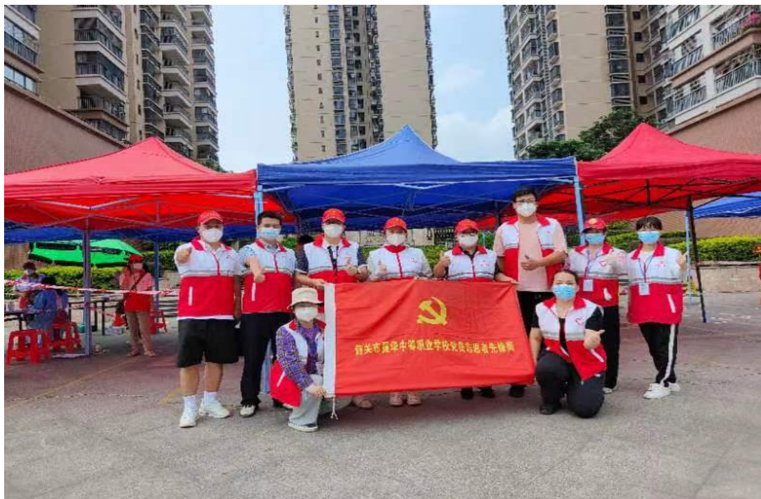
图 4-2 教师志愿者响应号召参加乳韶社区核酸检测协助工作

为全面落实市疫情防控指挥部要求，进一步做好疫情防控工作，振华中职志愿服务队组织 20 多名教师志愿者根据社区分组安排主动出击，下沉一线，积极开展政策宣传、值班值守、筛查保障等疫情防控志愿服务活动，以实际行动守护人民群众生命健康安全。教师志愿者根据社区工作需要，服从调度，各司其职开展志愿服务。从上午 8 点到下午 3 点，志愿者们始终在现场维护秩序，同时提供指引、人员信息录入、解答群众疑问、防疫知识宣传等志愿服务，用高质量的志愿服务，保障了疫情防控工作的顺利有序推进。