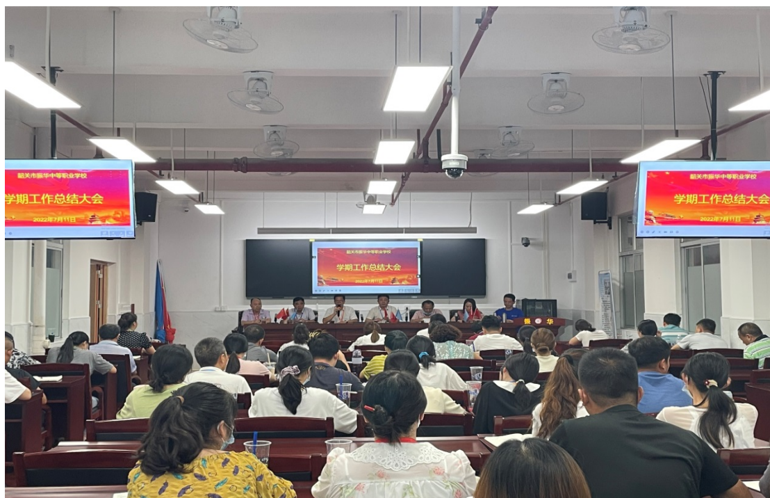
图 3-1 学期工作总结大会

学管理规范、教学方法恰当、师生良性互动、目标有效实现的课堂教学生态，全面提升课堂教学成效，提高人才培养质量。学校通过开学初的工作大会和学期末总结大会，检验每学期的工作完成情况，罗列数据，总结不足，为下一阶段寻求破解良策形成良性循环。