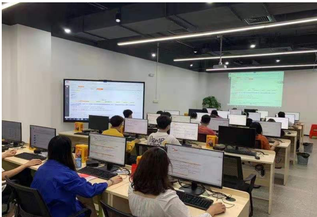
图 4-1 学生在中国联通华南智慧客服中心工作

学校坚持“以人为本，一切为了学生”的工作理念，以服务本地优质企业为工作重心，建立以学校为主导、专业部为主体、班级相对集中管理为基础的学生顶岗实习工作架构，明确任务，有序推进，确保顶岗实习率 100%，本地顶岗实习率 65%以上的工作目标。