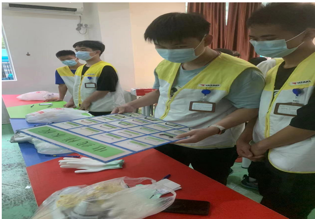
图 2-3-2 2022 届机电专业学生在实习单位岗前培训