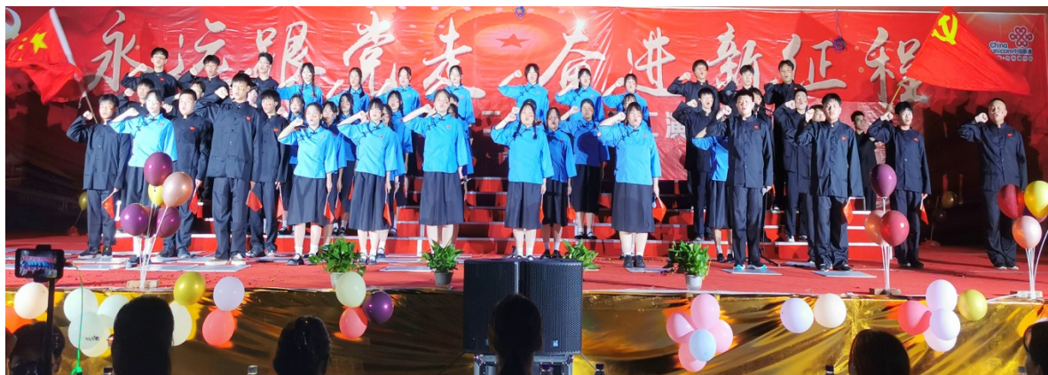
图 1-2 学校举行庆七一永远跟党走、奋进新征程文艺汇演

振华中等职业学校坚持立德树人、德艺双修，推动思想政治教育与技术技能培养融合统一。学校严格按照《中等职业学校思想政治课程标准（2020 版）》，选用国家规定教材，开足足额学时，开全开足“中国特色社会主义”、“心理健康与职业生涯”、“哲学与人生”“职业道德与法治”等必修课程内容。加强思政教师队伍建设，改革思政课程教学方式，因地制宜、因时制宜、探索课程评价方式，切实提高思政课程育人实效。学校利用建党 100 周年、庆七一、喜迎十九大等国家重大节日举办多样化的思想政治教育活动，进一步贯彻党的教育方针和领导方向，教育同学们把握机遇、勤奋学习，做“五好”青少年。