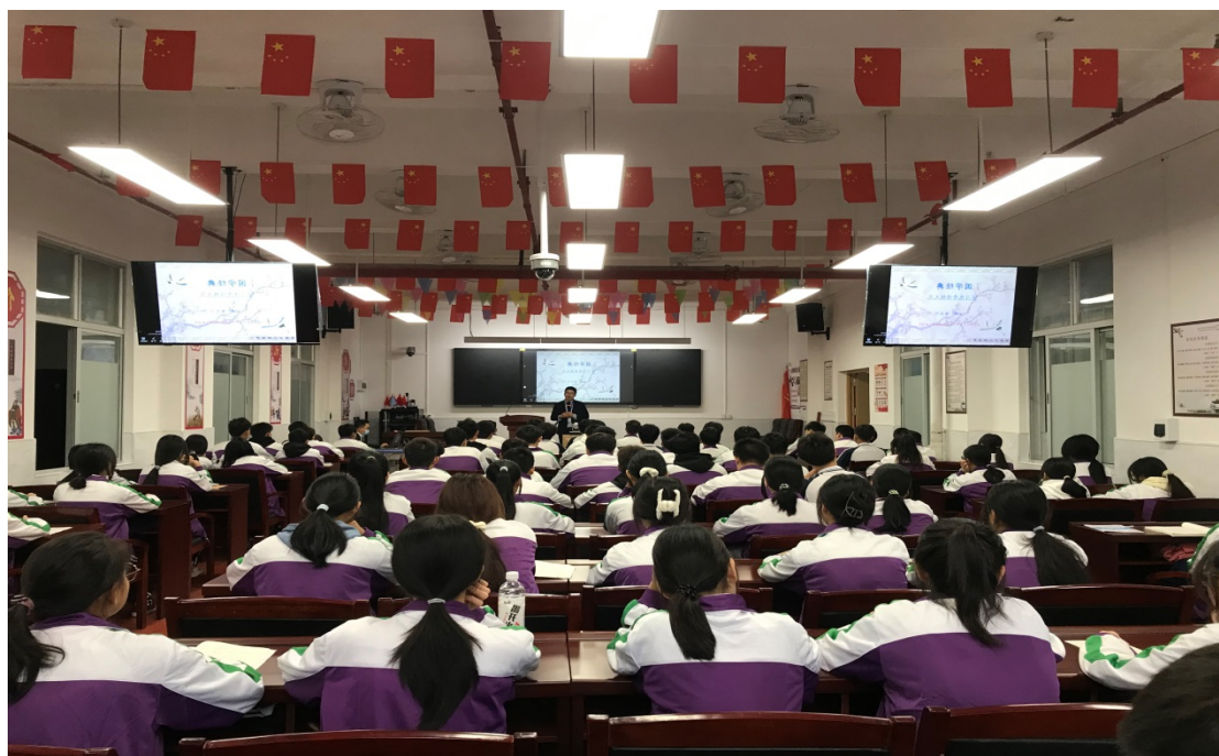
图 1-1 万良州老师的传统文化学习公开课

学校从 2012 年有缘引入传统文化教育进校园，上下掀起学习热潮，教育教学围绕传统文化学习进行改革，一年级以《弟子规》、二年级以《朱子治家格言》、三年级以《大学》、《礼记》等为主要课程抓手，每天早读全校诵读经典，每周安排 2-4 节的解读、力行课堂，学生每月力行实践，传统节日各班开展好人好事比赛。经过课堂的教育和环境的熏陶，学生的思想品德、文明礼貌都大大改善，既解决了要我学到我要学，也解决了不良行为习惯的改正，家长感觉到孩子的变化与成长，为学校的良性发展奠定基础。